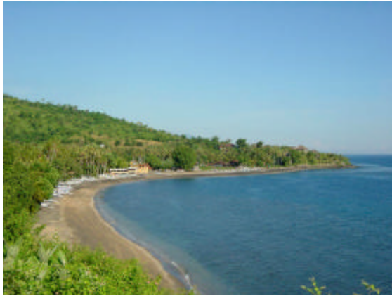
Vue d'Amed à la fin de la période des pluies ( de décembre à mars )