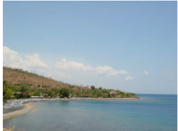
Vue d'Amed à la fin de la période sèche ( de avril à novembre )