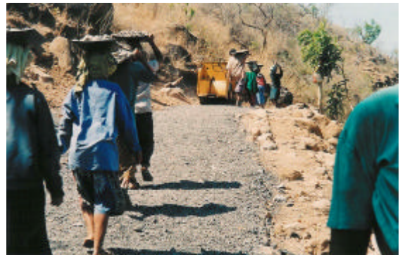
Les villageois travaillent au goudronnage de la route, ce qui va permettre de relier des maisons isolées.