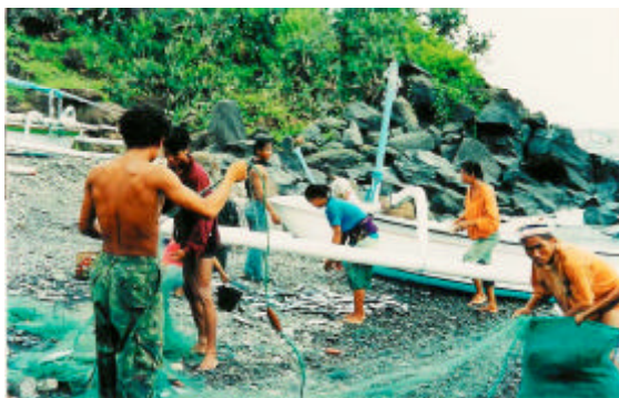
L'achat de filets leur permet de faire des pêches plus abondantes.