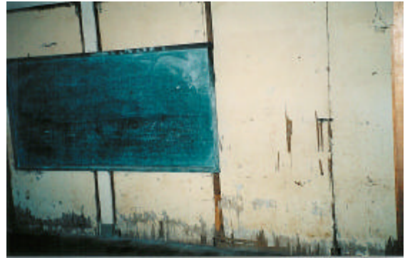
Projet pour refaire les classes en très mauvais état.