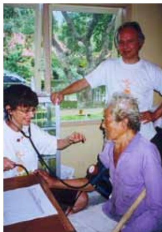
Consultations et check up à Panji Anom