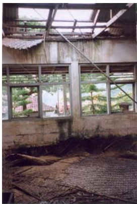
Ecole de Bangle SD n°2 région de Bunutan

Editorial: A l'heure où l'essence a doublé en Indonésie entraînant tous les prix à la hausse, notamment le riz, ce sont les plus démunis qui ressentent le plus de difficultés dans ce qui faut bien appeler 'leur survie'. Anak plus que jamais à son rôle à jouer auprès des enfants et des familles en redonnant un peu d'espoir mais aussi auprès des autorités locales en stimulant les énergies. Nous sommes donc heureux de vous présenter l'aboutissement des travaux concernant les écoles de Bunutan. De nombreux élèves peuvent ainsi étudier dans de meilleures conditions. Notre joie est d'autant plus grande puisque nous avons le soutien des autorités locales qui financent même certains projets.