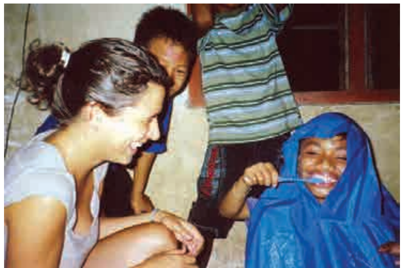
Qui rigole le plus ?

La joie qui découle de ces moments là est aussi intense pour les enfants que pour les organisateurs