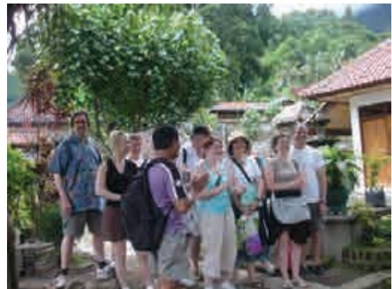
Groupe Yves Rocher à Sega

Merci à « Baliautrement », voyagiste qui nous a donné 5.000 euros pour l'an 2007