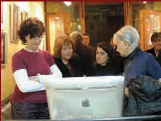
Commentaires sur la vie quotidienne des enfants d'ANAK à Bali

Après la projection des deux CD s'est tenu un colloque avec les personnes présentes qui se sont montrées très intéressées par les actions d'ANAK et ont envisagé une éventuelle adhésion. Nous leur ferons parvenir des demandes d'inscription.