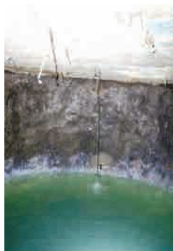
Achat d'une nouvelle pompe à Lean ; 22.500.000 roupies