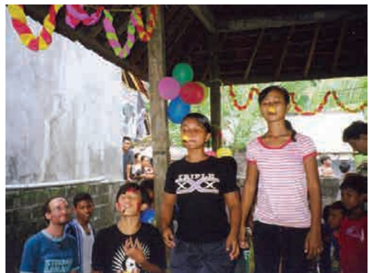
Découverte de jeux d'adresse