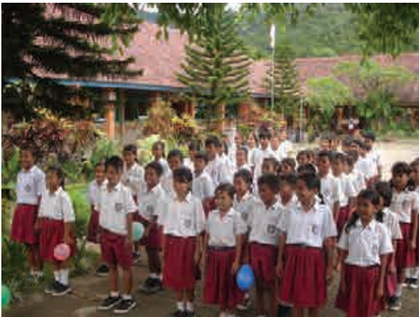
Enfants et adultes chantent ensemble à l'école

Yves Rocher a eu la bonne idée d'offrir un voyage à Bali à ses meilleurs vendeurs Cette journée faisait partie de leur programme de visites cette année prouvant une fois de plus que commerce peut rimer avec cœur et conscience. Merci à Yves Rocher pour les dons et cadeaux.