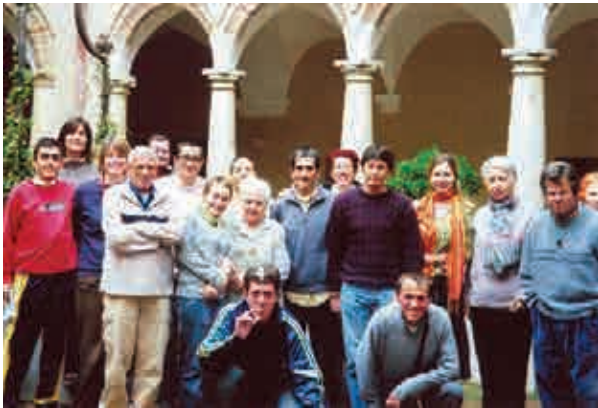
Membres du centre dans la cour du couvent

Après la projection des deux CD s'est tenu un colloque avec les personnes présentes qui se sont montrées très intéressées par les actions d'ANAK et ont envisagé une éventuelle adhésion. Nous leur ferons parvenir des demandes d'inscription.