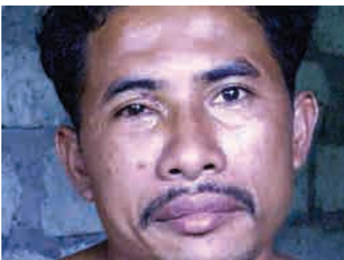
Après l'opération. Coût 1.700.000 roupies