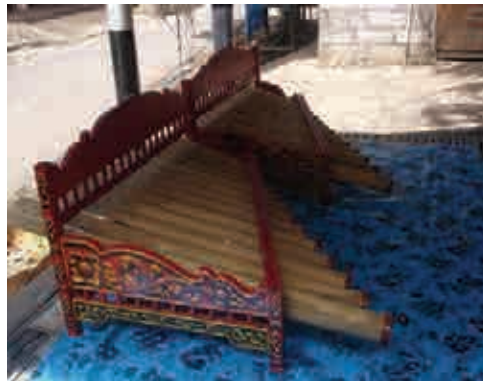
Achat de Rindik (instrument musical) pour Lean