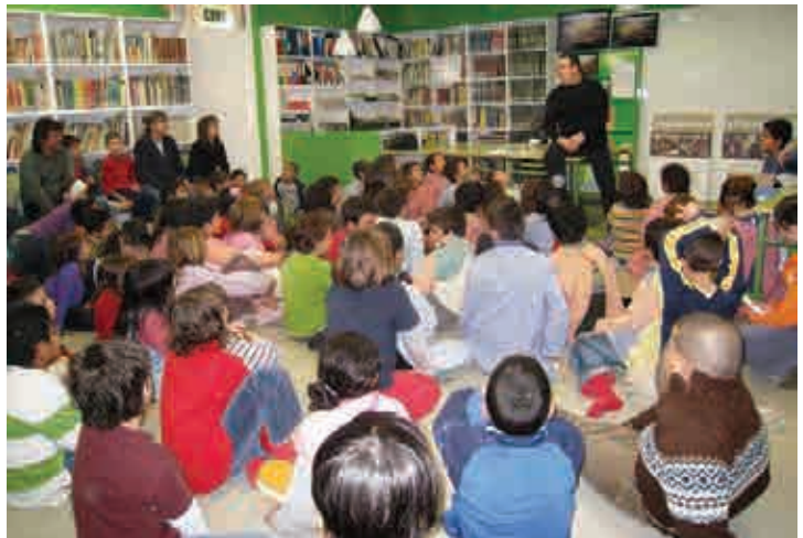
Un des groupes d'élèves posant des questions

Pour notre part, en plus de réaliser un de nos objectifs programmé pour ANAK : rendre possible la rencontre entre garçons et filles espagnols et indonésiens au travers d'une correspondance ou échanges artistiques et culturels entre écoles et associations; bien que d'une façon virtuelle comme dans ce cas ; nous nous réjouissons de vivre en direct l'intérêt que les enfants démontrent devant d'autres enfants défavorisés de cultures différentes.