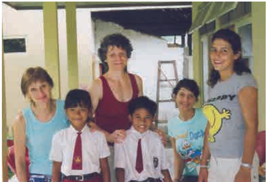
2 infirmières, 2étudiantes, 2enfants parrainés

Le plus naturellement, nous souhaitons remercier toutes les personnes que nous avons côtoyées pendant ces 6 mois et qui nous ont ouvert un regard bien plus grand sur la situation d'une petite île indonésienne bien connue pour ses surfers, mais moins pour ses enfants et ses familles en difficulté !