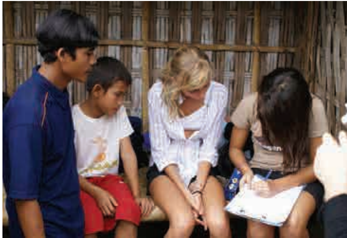
Interview du filleul et de son père

Les élèves de la classe de 5ème EFIB nous ont rendu visite le 9 mai 2008 à l'école de Bangle et dans le hameau de Sega pour rencontrer un enfant parrainé.