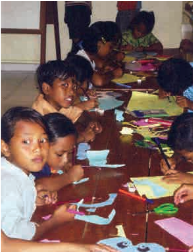
Atelier de fabrication de masques par Sayo