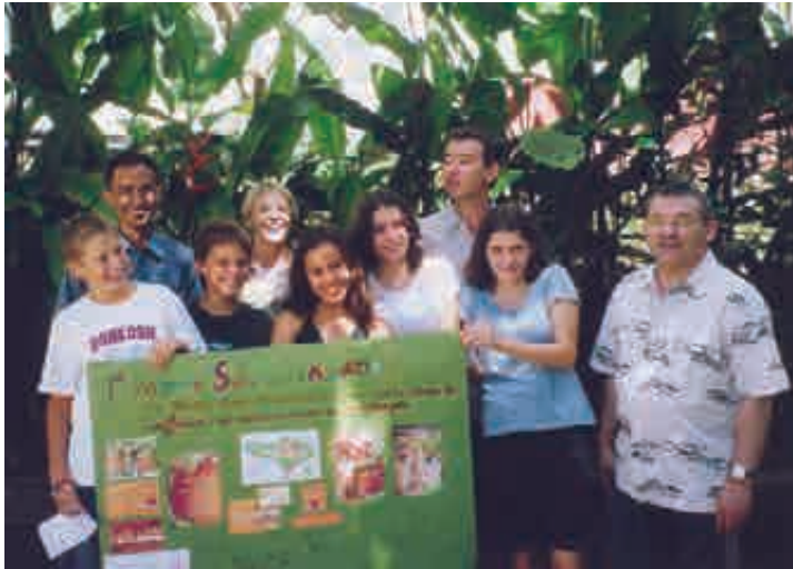
Classe de 5ème de l'année 2006-2007

C'est se sentir lié aux autres et vouloir vivre dans une société plus juste. Et au lieu de rester assis les bras croisés, nous avons décidé d'effectuer nous-mêmes une action solidaire envers une association. Plus précisément, nous voulions tous aider les enfants de Bali et à acquérir une meilleure éducation.