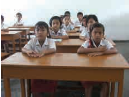
Equipped de meubles pour l'école SD4 à Pakisan. 4.500.000 roupies