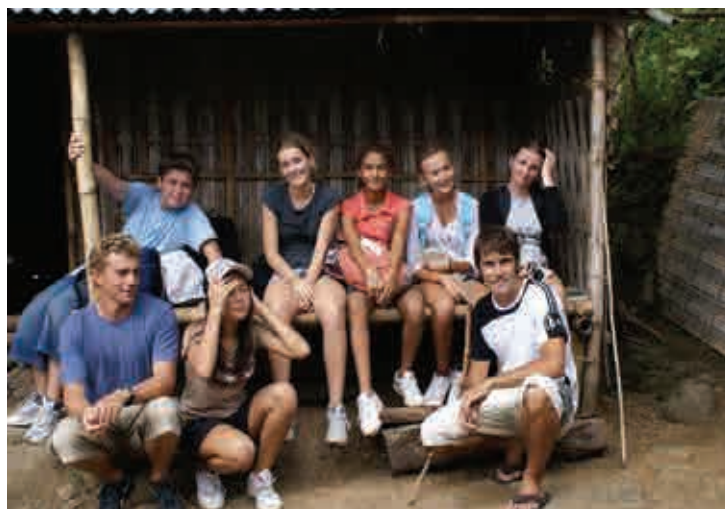
Elèves et leurs professeurs.