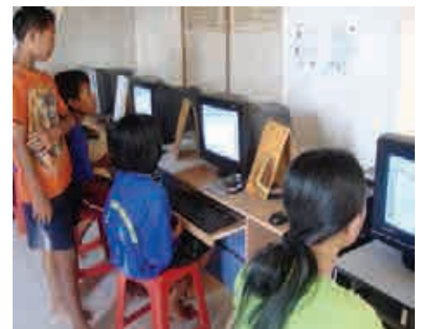
Les Cours d'informatique ont commencé à Panji Anom