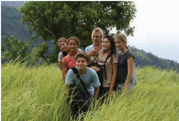
Elèves dans l'effort de l'escalade

ANAK a été invitée à tenir un stand avec la classe lors de la kermesse annuelle de son Etablissement le 25 juin 2008. Ils pourront ainsi partager leur expérience sur le terrain avec les visiteurs.