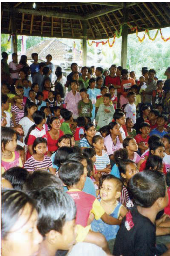
Plus de 200 enfants au rendez-vous