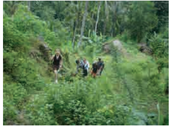
Montée au village de Sega