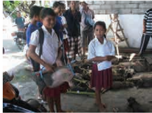
Distribution de cochons pour les familles