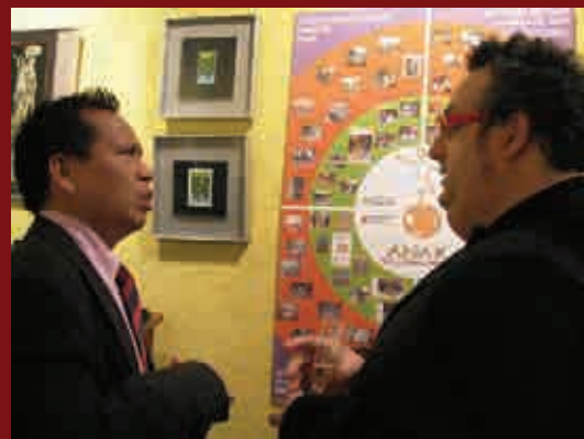
L'Attaché socio-culturel de l'Ambassade d'Indonésie à Madrid montrant son intérêt pour ANAK