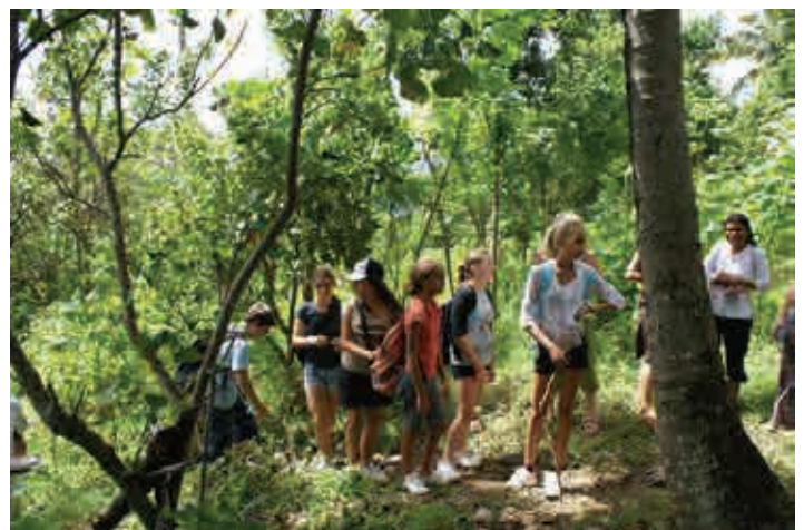
Ascension à Sega chez un filleul