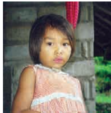
Opération d'un bec de lièvre. Coût 800.000 roupies