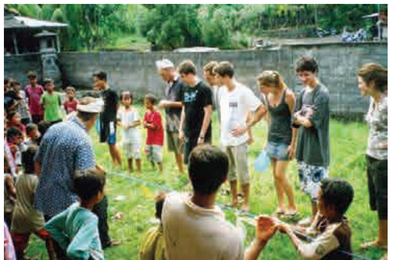
Qui va gagner ?

La joie qui découle de ces moments là est aussi intense pour les enfants que pour les organisateurs