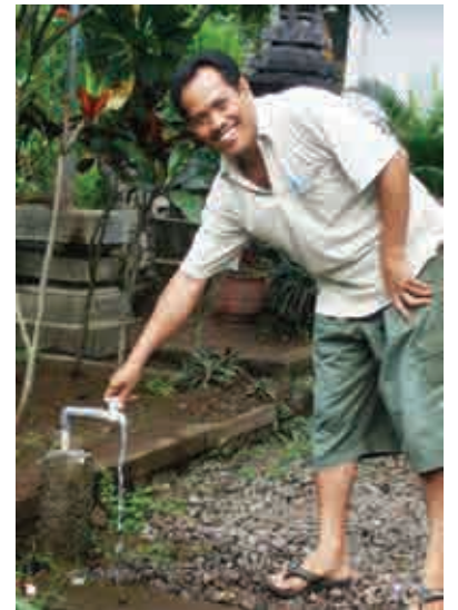
Réparation des tuyaux d'eau au collège d'Abang N3 ; 10.500.000 roupies