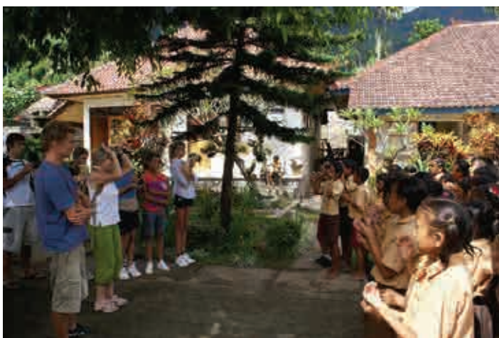
Visite de la classe de 5ème à SD2 Bangle Mai 08

Après tout, des petits efforts peuvent avoir un grand effet, notre projet en est la preuve. Et comme disait Lao Tseu, « Mieux vaut allumer une bougie que maudire les ténèbres ... »