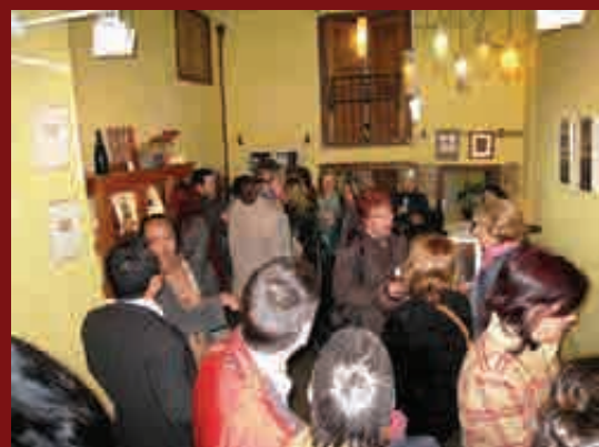
Lors de l'inauguration