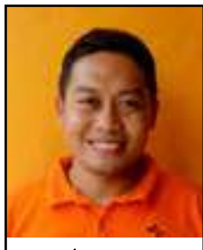
Artama, coordinateur à Pakisan